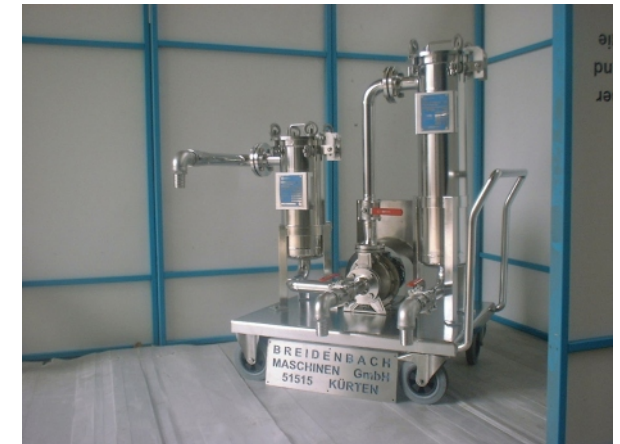
Mobile Pumpen Beutelfilterstation Werkstoff 1.4571

Legierungsanlagen, Blaseinrichtungen, VD / VOD / VAD - Anlagen, Lanzenhubvorrichtungen, Blaslanzen, Multifunktions-lanzen, Gießpfannentransportwagen, Fördertechnik, Sonderkonstruktion etc.